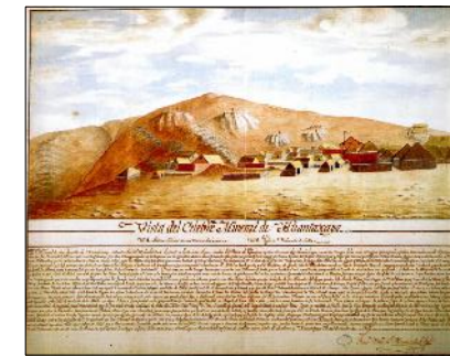
Acuarela de Francisco Xavier de Mendizábal de 1808