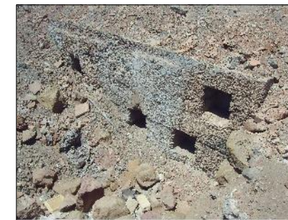
Ruinas Alto San Simón